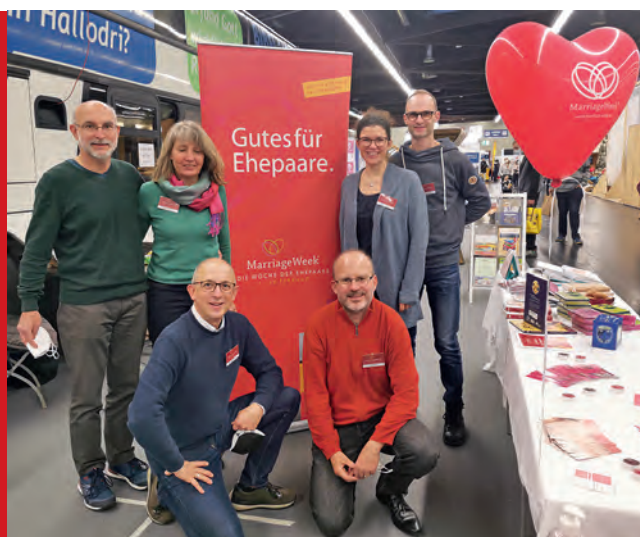
Team der MarriageWeek Nürnberg und Stein auf der Consumenta 2021

Sprecher für den MarriageWeek-Trägerkreis Region Nürnberg